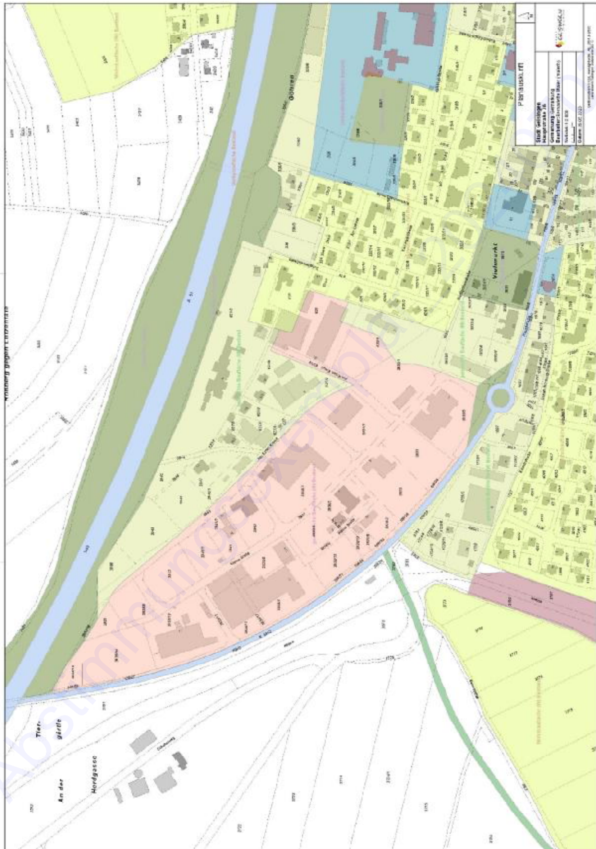
Abbildung 1: Auszug auf dem aktuell wirksamen Flächennutzungsplan