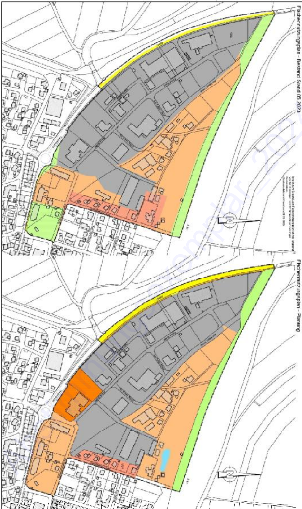
Abbildung 2: Auszug innerhalb Geltungsbereich – Bestand und Planung des FNP / vergleichende Darstellung